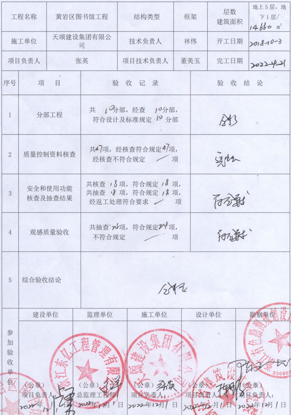
表 H.0.1-1 单位（子单位）工程质量竣工验收记录